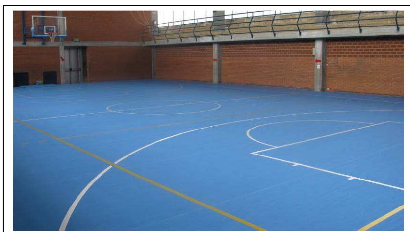
Nuova pavimentazione palestra a seguito di realizzazione di nuovo impianto di riscaldamento a pavimento.