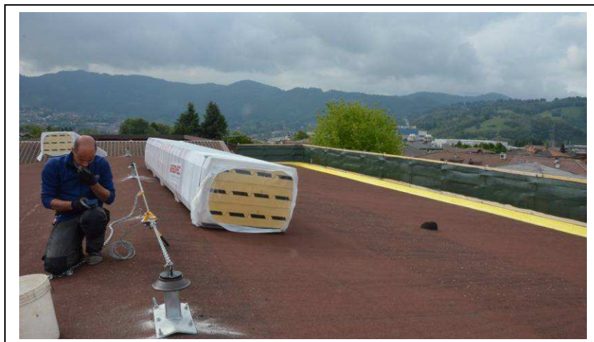
Rifacimento manto di copertura palestra con posa di pannelli coibentati e linea vita